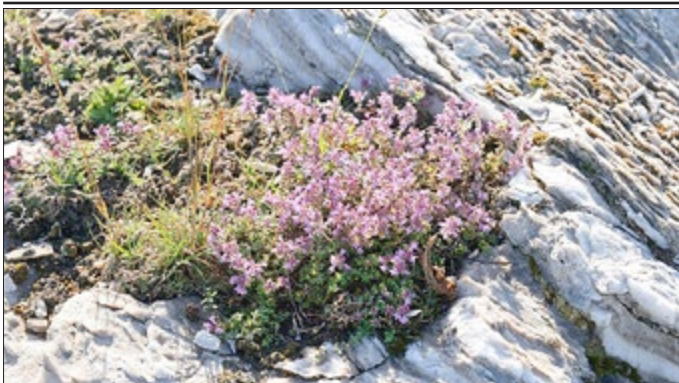
Thomas Stephan - Breitblättriger Thymian

Blüten, Knospen, Früchte, Blätter von Kräutern und Bäumen - sie alle lassen sich als Fotomotiv auf den Wiesen und in den Wäldern der Südharzer Gipskarstregion in großer Vielfalt entdecken. Der Fotowettbewerb im Rahmen des Hotspot-Projektes „Gipskarst Südharz - Artenvielfalt erhalten und erleben“ hat in diesem Jahr die Pflanzenwelt des Südharzer Gipskarsts zum Thema. Ob als Makrofotografie oder Panoramaaufnahme, als Schnappschuss oder gezielte Motivauswahl - das Hotspot-Team des Landschaftspflegeverbandes Südharz/Kyffhäuser e.V. (LPV) ist sehr gespannt und freut sich auf viele Einsendungen.