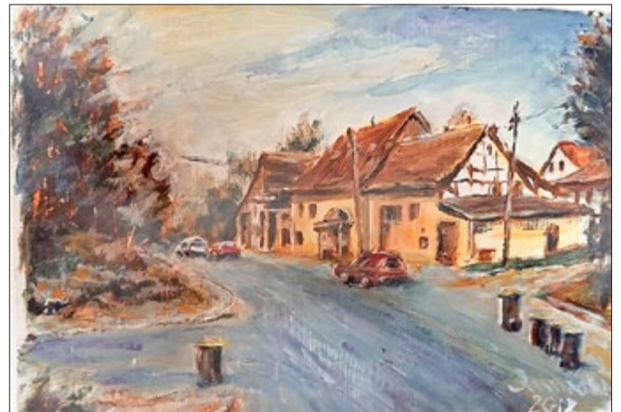
Die Scheunen am Uderslebener Weg sind immer wieder ein beliebtes Motiv verschiedener Künstler