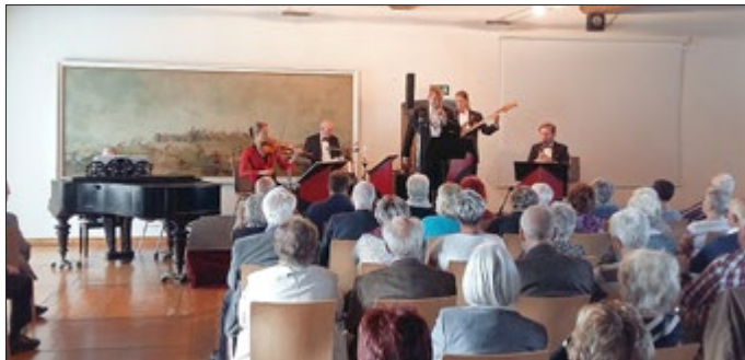
Festkonzert mit dem Orchester Franz L.

In diesem Jahr blicken wir auf 100 Jahre Museum zurück. Der Mai stand mit seinem vielfältigen Veranstaltungsangebot ganz im Zeichen dieses Jubiläums. In der Regel erfolgt die Planung für ein solches Ereignis schon viele Monate im Voraus. In dieser Zeit der Pandemie haben wir jedoch gelernt, noch spontaner als sonst zu sein.