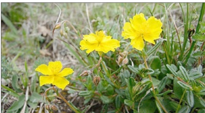
Thomas Stephan - Ovalblättriges Sonnenröschen

Blüten, Knospen, Früchte, Blätter von Kräutern und Bäumen - sie alle lassen sich als Fotomotiv auf den Wiesen und in den Wäldern der Südharzer Gipskarstregion in großer Vielfalt entdecken. Der Fotowettbewerb im Rahmen des Hotspot-Projektes „Gipskarst Südharz - Artenvielfalt erhalten und erleben“ hat in diesem Jahr die Pflanzenwelt des Südharzer Gipskarsts zum Thema. Ob als Makrofotografie oder Panoramaaufnahme, als Schnappschuss oder gezielte Motivauswahl - das Hotspot-Team des Landschaftspflegeverbandes Südharz/Kyffhäuser e.V. (LPV) ist sehr gespannt und freut sich auf viele Einsendungen.