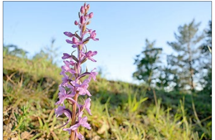
Silke Staubitz - Mücken-Händelwurz

Bis zum 30. September 2022 können die Fotografien für den Fotowettbewerb per E-Mail an hotspot-suedharz@lpv-shkyf.de gesendet werden. Alle Informationen rund um den Wettbewerb sowie die zugehörige Datenschutzerklärung sind auf der Projekt-Website www.hotspot-gipskarst.de zu finden. Eine Jury des LPV unter Vorsitz des Vorstandsvorsitzenden Egon Primas wird die drei schönsten Fotos, die mit wertvollen Sachpreisen prämiert werden, auswählen. Aus einer Auswahl der schönsten Bilder wird der Hotspot-Jahreskalender 2023 entstehen sowie eine Fotoausstellung für die Öffentlichkeit, deren Ort und Termin zu gegebenem Zeitpunkt bekanntgegeben werden.