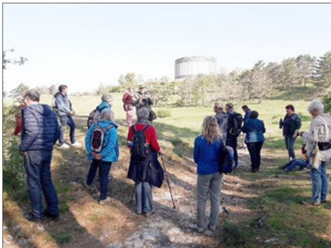
Naturkundliche Exkursion am frühen Morgen

Letztendlich konnte das Veranstaltungsprogramm mit Konzert, Vorträgen und einer Exkursion durchgeführt werden.