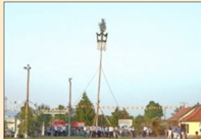
Impressionen vergangener Feste

Ende April wurde traditionell der Festbaum durch die Udersleber Burschenschaft im Kyffhäuserwald geschlagen.