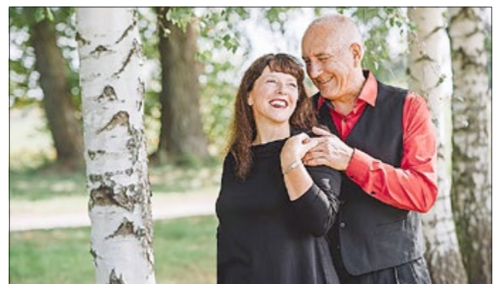
Duo „con emozione“

Sie sind im Regionalmuseum keine Unbekannten. In jedem Jahr eröffnen Sie die Veranstaltungen im Museum mit Ihrem Neujahrskonzert, dieses mußte wegen bekannter Umstände nun schon zum 2. Mal verschoben werden. Der neue Termin ist der Samstag, 2. Oktober 2021.