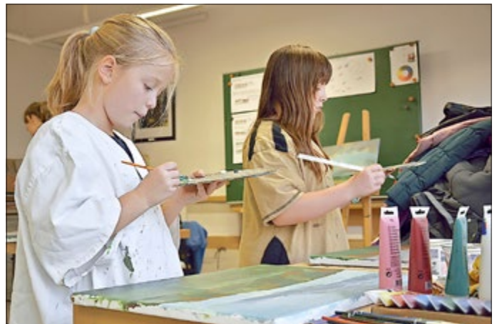
Rechteinhaber: Fred Böhme / Archiv Panorama Museum, dem Bildurheber liegt eine schriftliche Erlaubnis der Eltern des Kindes vor, die einer Veröffentlichung in der Presse zugestimmt haben. Fred Böhme