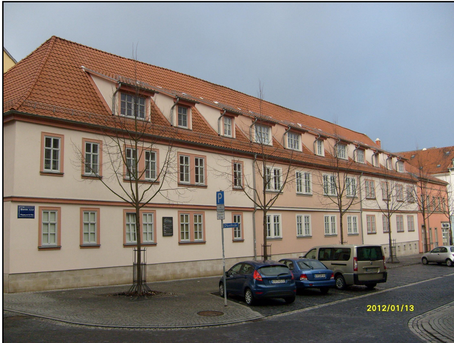
Zustand nach Sanierung, Blick zur Trinitatiskirche im Süden