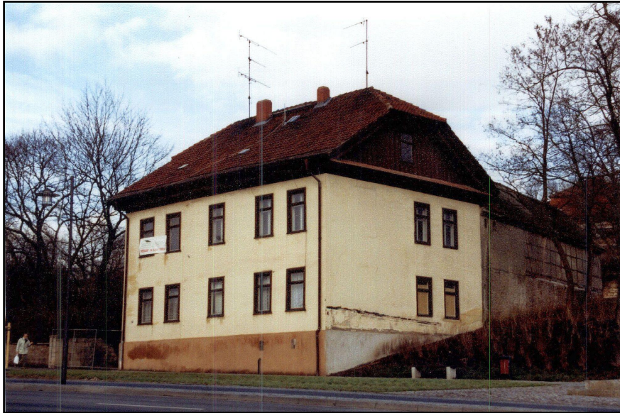
Temporäre Nutzung als Werbeträger für jährliche Schlossfestspiele bzw. Landesausstellung, Lohberg 11, Sondershausen