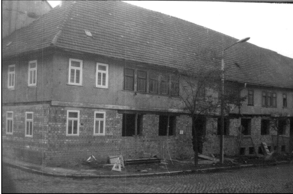
Zustand vor Sanierung 2002